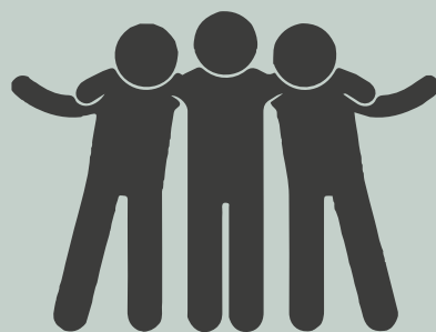
Freunde & Netzwerk